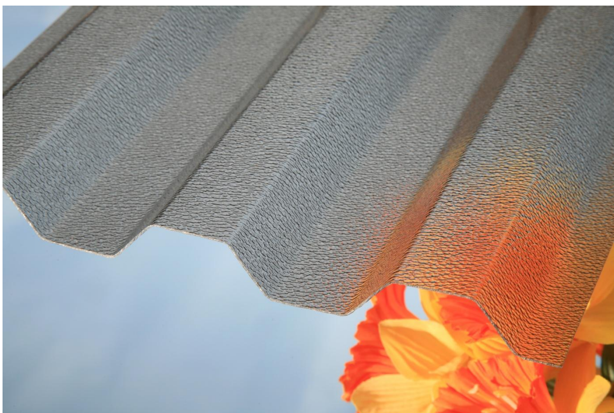
MARLON CSE TR 76/16 0,8 mm ORIGINAL bronz