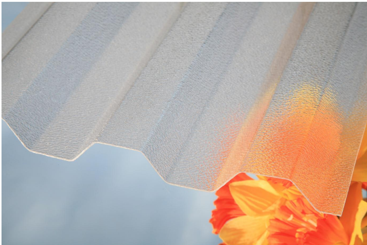
MARLON CSE TR 76/16 0,8 mm ORIGINAL čirá