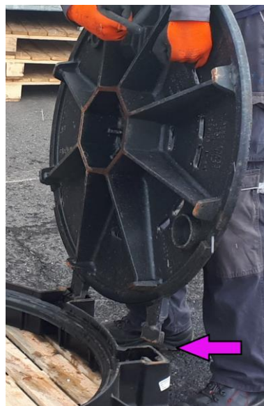
naklopením doprava umožníte vyjmutí víka z rámu či odblokování aretace