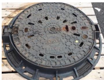
PAMREX DN 600