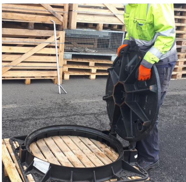
Lehce nadzvednout levou stranu víka v pozici 90° (použijte madlo na vnitřní straně víka)