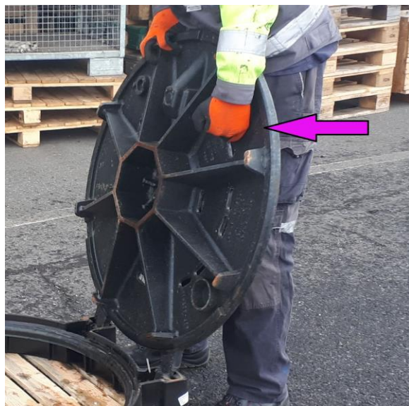
madlo na spodní straně víka DN 800