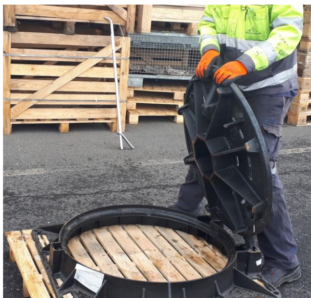
Víko nakloňte nad rám volně jej pusťte, tak aby dopadlo do rámu. Víko je bezpečně vedeno kloubem.