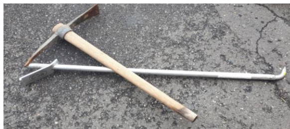
manipulační nástroje – krumpáč, tyč C24