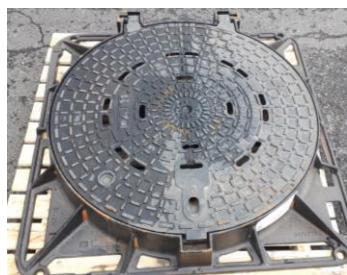
PAMREX DN 800